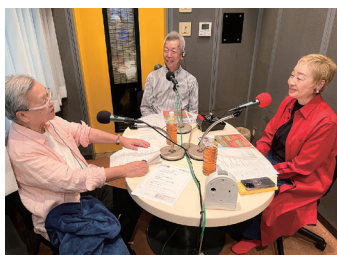
Yes'fmのJAZZ番組「夫婦でオジャ漬け。毎週月曜日22時より

現在は毎週月曜日22時よりYes'fmのJAZZ番組「夫婦でオジャ漬け」を担当。2024年11月24日に行われる『大塚善章音楽生活70周年記念卒寿リサイタル』では、プロデュースやMCを担当する予定です。