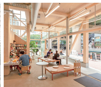
β本町橋に行けば、誰かに会える。そんな想いから生まれた水辺の実験基地

にもっとワクワクを」をテーマに、「そこに行けば、誰かに会える」「この指とまれが見つかる」「かつての“空き地”のような場所がいま改めて、町に必要なのかもしれない」。そんな熱い想いを胸に水辺の実験基地「β本町橋」を作り、地元の人々との多彩な交流を深めています。